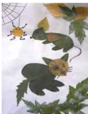
Хто кого ловить?