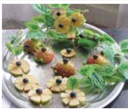
Їжачки на квітучій галявині