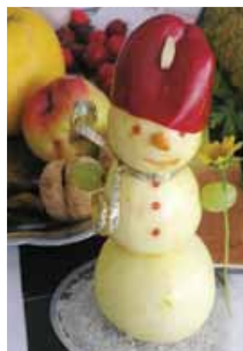
Картопляний сніговик сонця не боїться