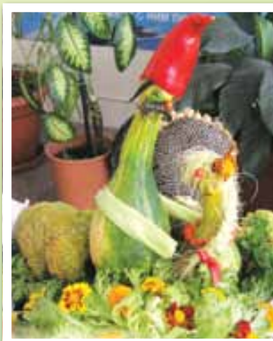
“Стояв старий з молодю, Як із ягідкою...”