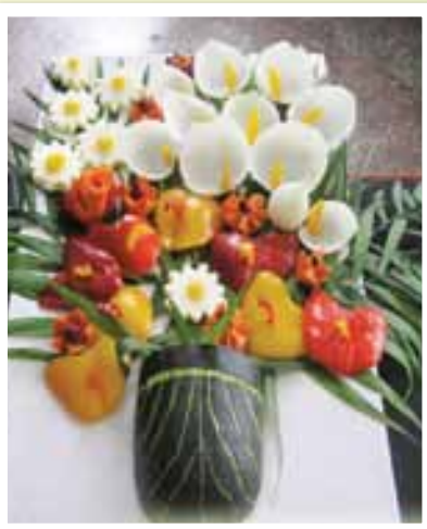
Розкішний осінній букет