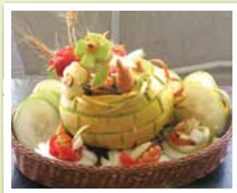
Осінь в гості завітала, Урожай подарувала