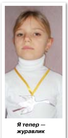
Я тепер — журавлик

Після урочистої обіцянки другокласники передають першокласникам велику картонну фігуру журавля — символ об'єднання, який наступного року вони передадуть дітям, що прийдуть до школи і поповнять ряди