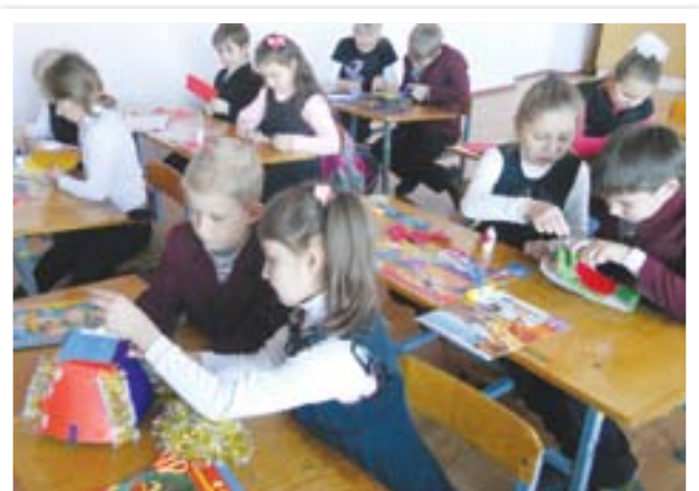
Самі вчимося виготовляти Костюми до вистав на свято