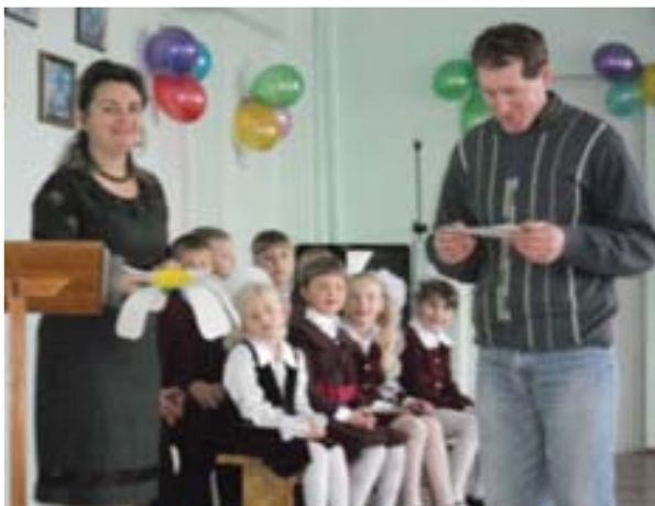
Татусям чудове свято Влаштували журавлята

журавлят. Учні 4-х класів вручають кожному першачку символ ДО «Журавлики» — невелику фігурку журавля, на стрічці, яку можна повісити на шию.